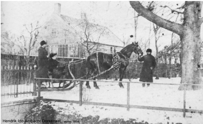
Hendrik Ido Ambacht Dorsstraat winter 1894

Wij wensen alle medewerkers en leden van het Historisch Genootschap en een ieder die dit onder ogen komt, een goed en gezond 2020 !