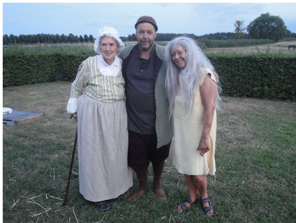
Herkent u ze (nog)?