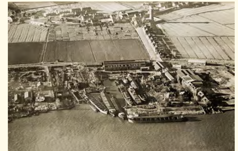
Scheepswerf Jonker & Stans vóór 1953 want de huizen op de Veerweg staan er nog.

Na de spraakmakende films 'De scheepsslopers van Ambacht' en 'De tuinders van Ambacht' wordt er momenteel hard gewerkt aan de volgende film 'De scheepswerven van Ambacht'. Deze film zal hopelijk in het najaar klaar zijn en willen we dan graag aan u vertonen. Zodra we meer weten, kunt u dat lezen in de Nieuwsbrief of in het volgende mededelingenblad.