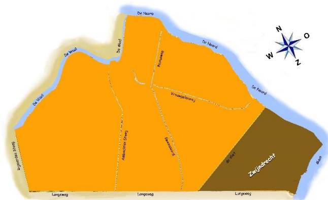
1855 - heden

Toen vond er - bij de start van het Kadaster - een herverdeling plaats in de Zwijndrechtse Waard. Men wilde dat de hoofdlanden en het volgerlanden van de diverse dorpen zouden aansluiten op elkaar. Het gevolg voor ons dorp was dat de meeste volgerlanden ten noorden van de Langeweg bij ons dorp werden gevoegd en wij ons verre volgerland kwijtraakten aan Zwijndrecht. Ook ten zuiden van de Dorpsstraat raakten we het land tussen Reeweg en Sandelingenambacht kwijt aan Sandelingenambacht. Dit duurde tot 1855.